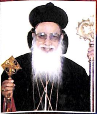
പ. ബസേലിയോസ് മാർത്തോമ്മാ മാത്യൂസ് ഭിതീയൻ കാതോലിക്കാ ബാവ